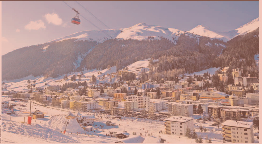
In der Szenerie von Thomas Manns Jahrhundertroman „Der Zauberberg“ treffen sich Größen aus Wirtschaft, Politik, Wissenschaft und auch Kultur

Einkommen der Landbevölkerung steigen Erstmals seit 1997 sind in China die Durchschnittseinkommen auf dem Land stärker gestiegen als in den Städten. Nach Angaben der Statistikbehörde stieg das Pro-Kopf-Einkommen im ländlichen Raum um 10,9 Prozent auf 898 Dollar (664 Euro). Dennoch verdienen die Menschen in den Städten noch immer fast dreimal so viel.